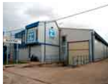
Delegación Vitoria (1990)