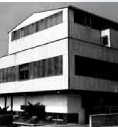
tra. San Sebastián 1978