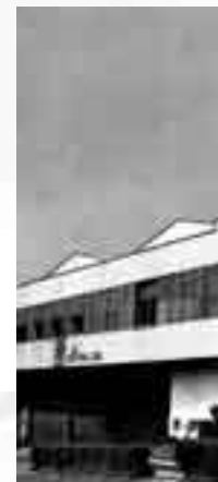
Primera sede de Elektra