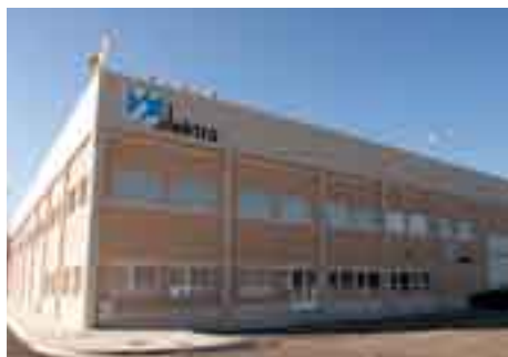
Delegación Orkoien (2000)

SAN SEBASTIAN – MARTUTENE PAMPLONA – POL. LANDABEN OLABERRIA – CARR. NACIONAL, 1 ELGOIBAR – POL. INDUSTRIAL LERÚN ARRASATE – POL. KATAIDE VITORIA – CAPELAMENDI, 10 TUDELA – POL. CANRASO BURGOS – COMPLEJO TAGLOSA PALENCIA – EXTREMADURA, 18 ORKOIEN – POL. MENDIKUR SAN SEBASTIAN – GLORIA, 1 TUDELA – FUENTE CANÓNIGOS, 10 VITORIA – URRUNDI CAPELAMENDI, 1