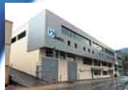
Delegación Elgoibar (1979)