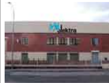
Delegación Palencia (2001)