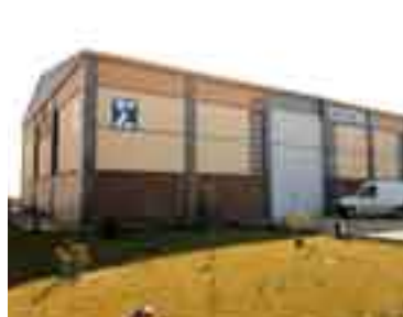
Delegación Tudela (1991)