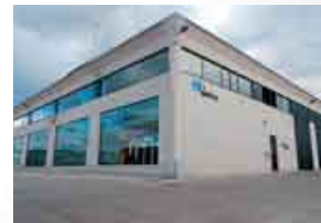
Delegación Vitoria - Urrundi (2002)