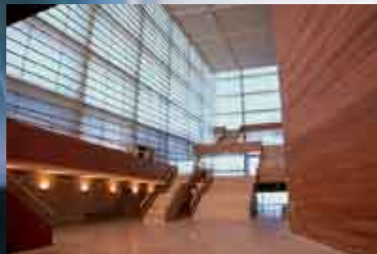
Palacio de Congresos Kursaal