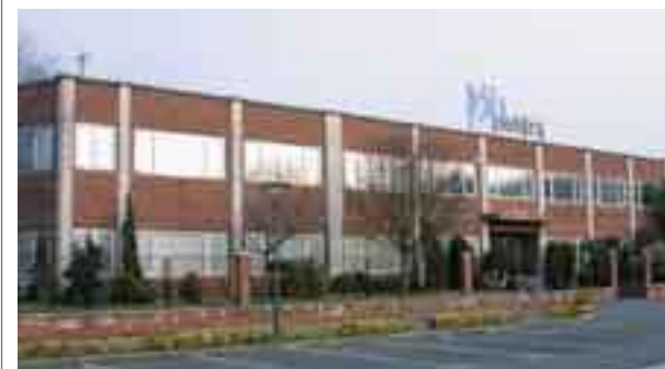
Sede Central actual en San Sebastián

En la trayectoria de Elektra han surgido también proyectos compartidos con una misma filosofía, que forman parte del Grupo Elektra: Baimen, Oleta-Berri y Selcansa, empresas dedicadas a la distribución de material eléctrico, y la más reciente, Vydektra, especializada en el sector de la instalación de voz y datos, como distribuidor de valor añadido.