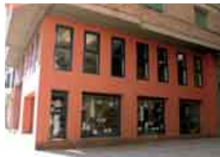
Delegación Tudela (2001)