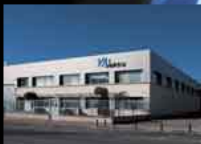
Delegación Pamplona (1978)