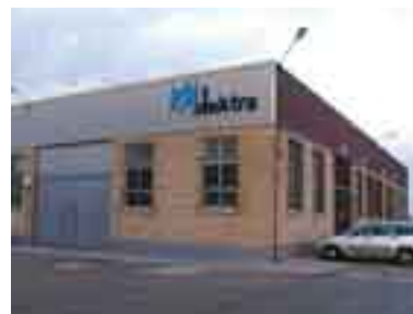
Delegación Burgos (1992)