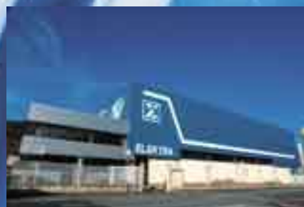
Delegación Olaberria (1979)