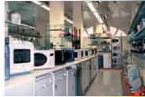
San Sebastián (1991)

Los electrodomésticos se adecuan al estudio realizado, siendo Elektra quien garantiza la instalación final de la cocina completa en casa del cliente.