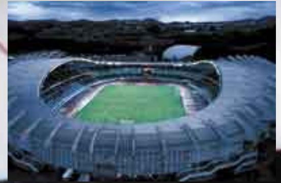
Estadio de Anoeta. San Sebastián