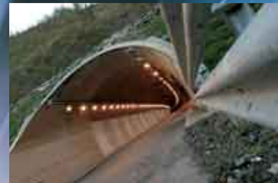
Túnel Autovía Málzaga-Vitoria