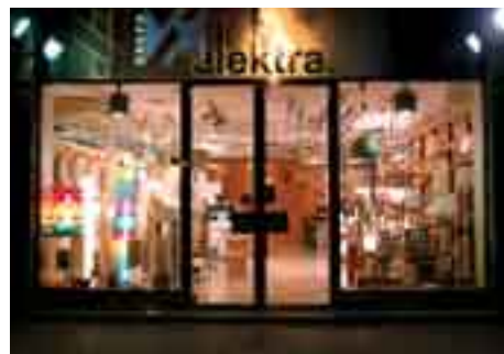
Delegación San Sebastián, Gloria, 1 (2001)